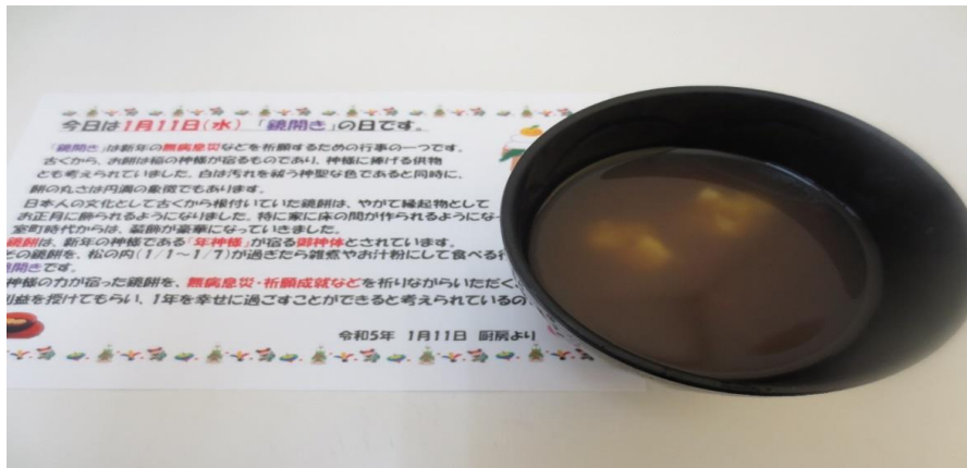
*やわらか餅入りぜんざい