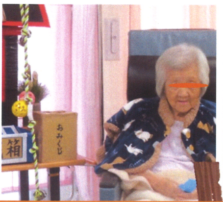
ひごろも神社でお参りしたよー！