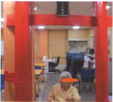
良い1年でありますように！